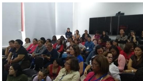
Asistentes a las presentaciones de ponencias en la Universidad Nacional de Colombia