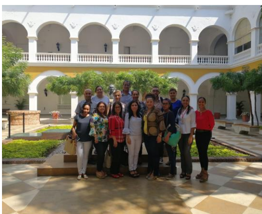
Encuentro Regional Caribe – U. de Cartagena

Durante los encuentros se procedió a realizar un trabajo por grupos para establecer aportes frente a la definición del objeto de Trabajo Social, posteriormente los participantes establecieron los aciertos, desaciertos y retos del proceso, que compromete a las unidades académicas, organismos profesionales (Consejo Nacional de Trabajo Social, CONETS y FECTS) y colectivos de profesionales y estudiantes de Trabajo Social del país.