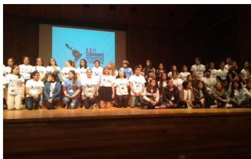
Estudiantes de Trabajo Social de Unidades Académicas de Bogotá y Cundinamarca que apoyaron la comisión logística.

El evento, apoyado por la gestión de las comisiones académica, logística, comunicaciones y financiera, estuvieron integradas por docentes de las unidades académicas de Trabajo Social de Bogotá y Cundinamarca (universidades Externado, La Salle, Monserrate, Nacional, Uniminuto, Mayor de Cundinamarca), quienes desde 2016 organizaron la logística académica y financiera del seminario, acompañados por el CONETS y por integrantes de la Junta Directiva de ALAEITS, organismo profesional latinoamericano que direcciona la realización de los seminarios latinoamericanos de Trabajo Social.