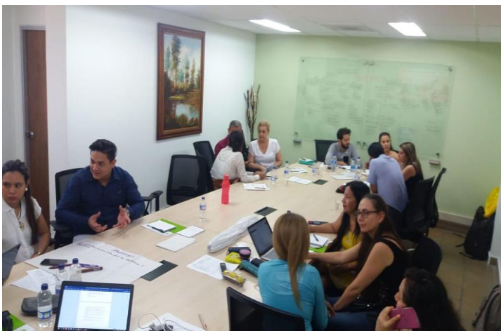
Encuentro Regional Nororiente – Noviembre 30 de 2018