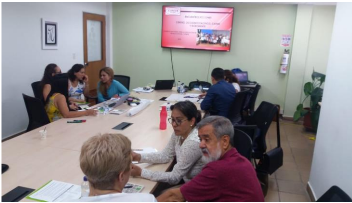
Encuentro Regional Nororiente – UIS