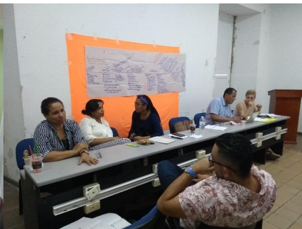
Encuentro Regional Caribe: Noviembre 26 de 2018