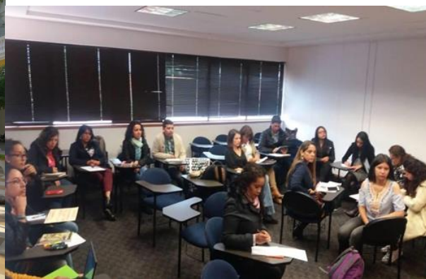
Encuentro Regional Centro – U. Externado